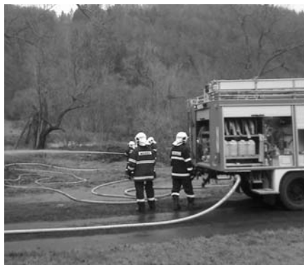
30. listopadu 2013 - společné cvičení JSDH Velichov a JSDH Vojkovice.