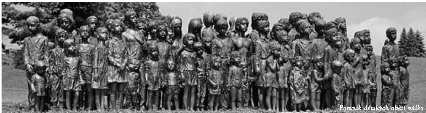
Pomník dětských obětí války