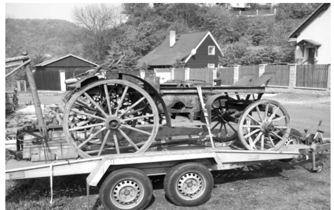
Stříkačka před renovací