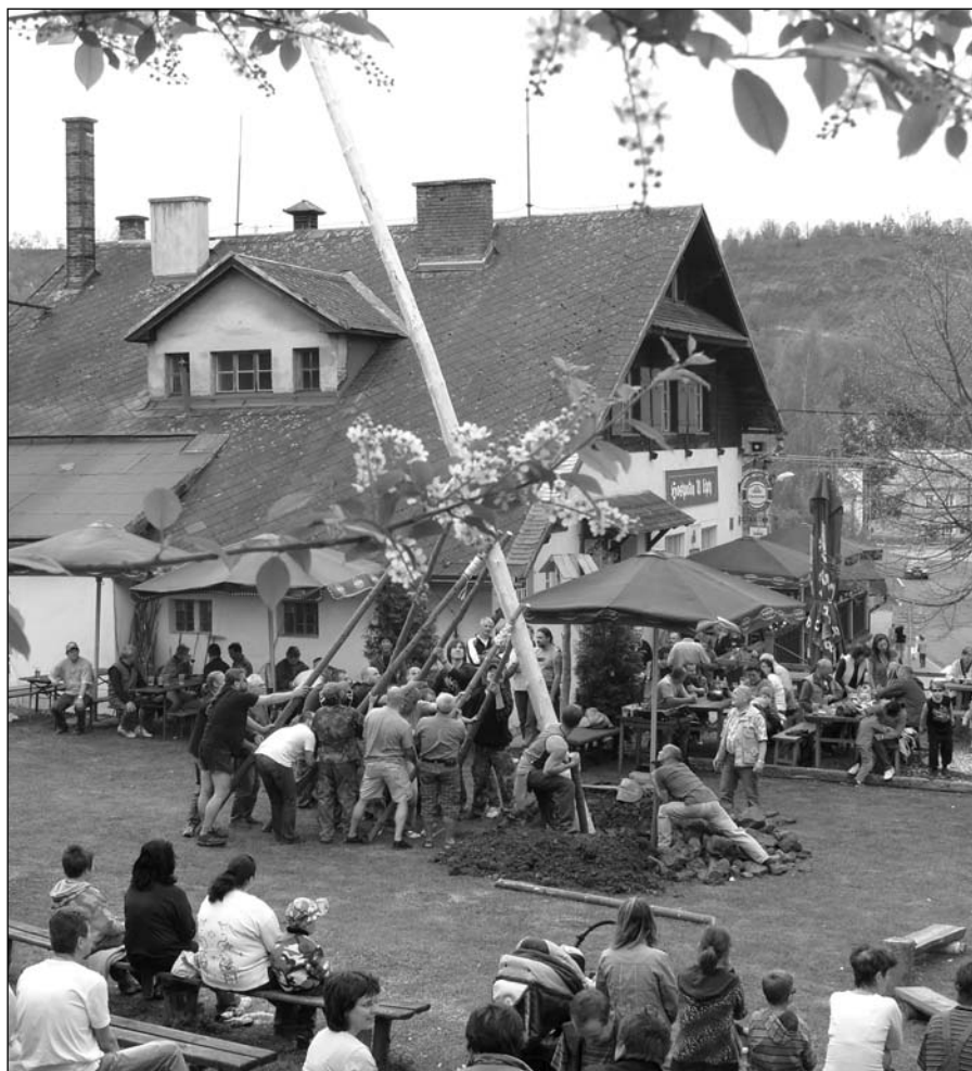
Májka byla ve Velichově úspěšně postavena i letos. Více fotografií naleznete v příštím vydání.