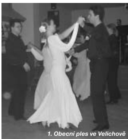
1. Obecní ples ve Velichově