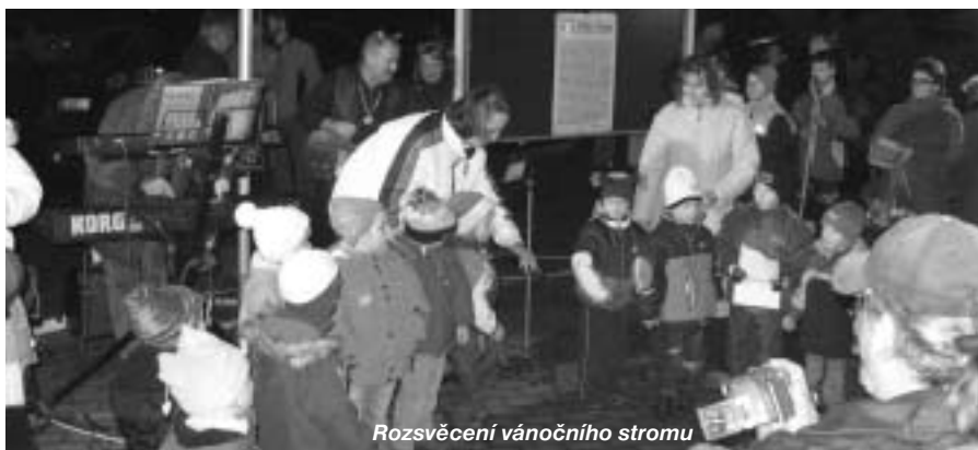
Rozsvěcení vánočního stromu