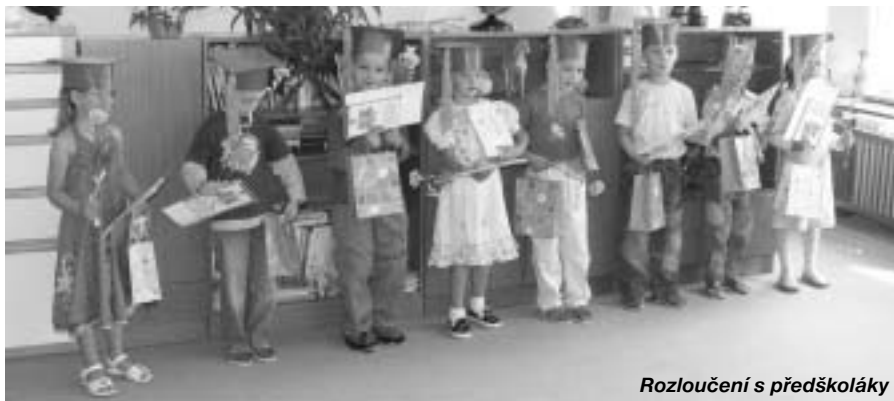
Rozloučení s předškoláky