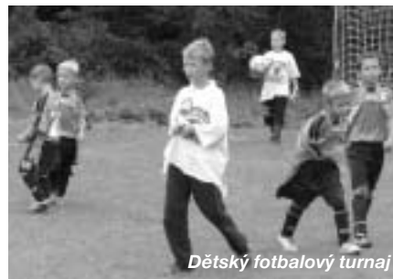
Dětský fotbalový turnaj