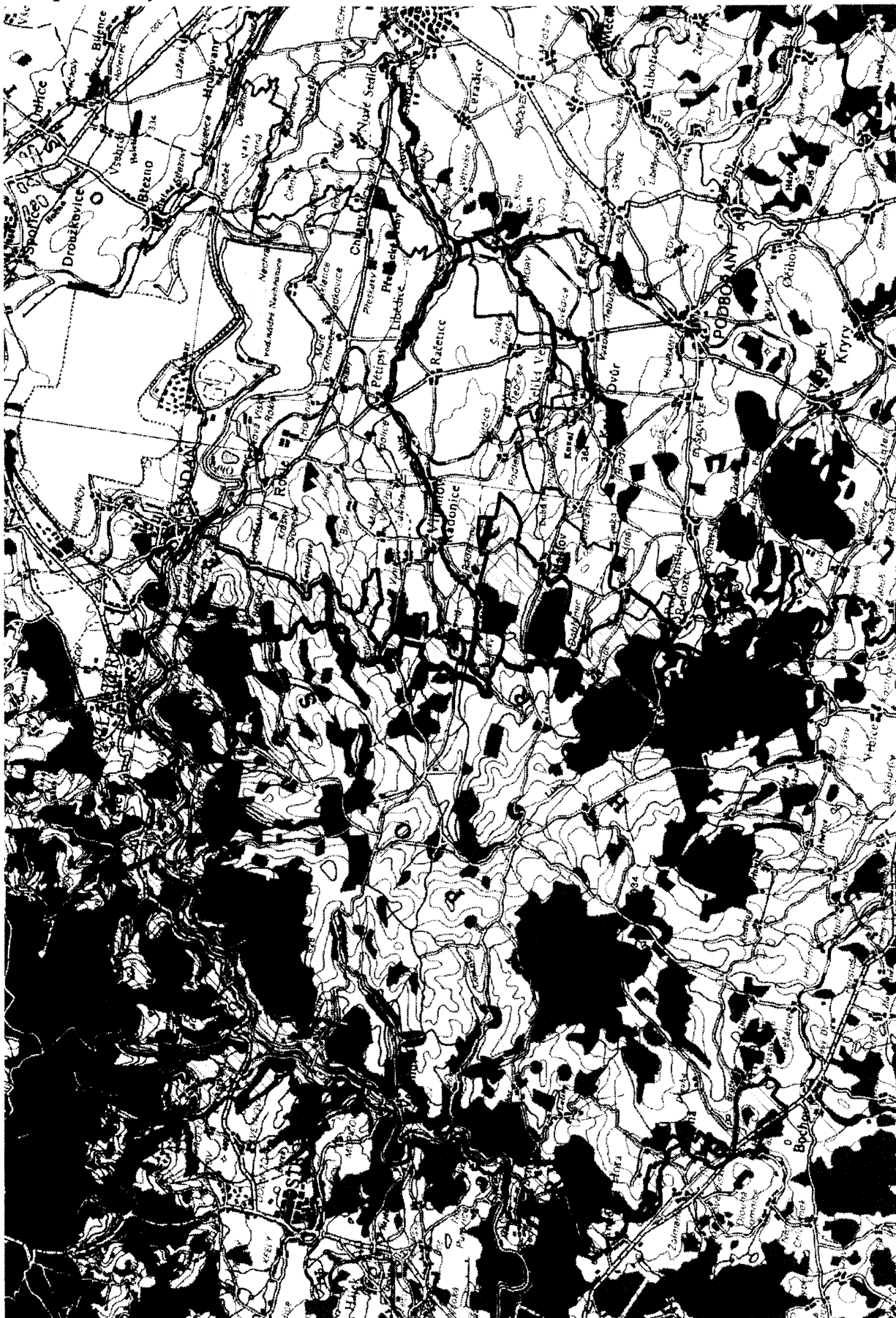
Mapa lokality CZ0424125